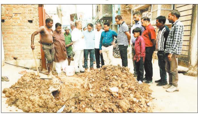
पाइप लाइन का निरीक्षण नवि नेता प्रतिपक्ष व अन्य।