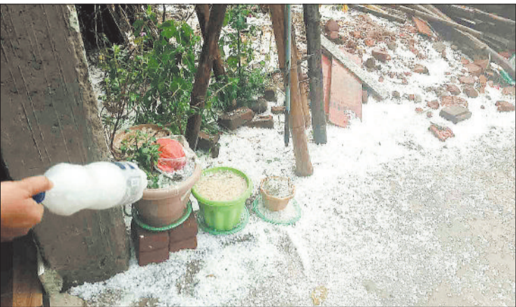
पर के सामने ओले का देर।