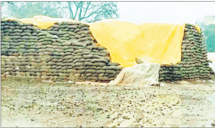
बारिश में भीगा समिति में पड़ा धान।