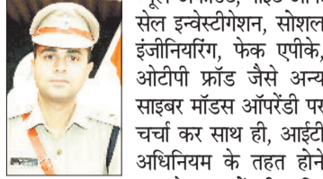
लंबित अपराधों का निराकरण करने के निर्देश

सोमवार को एसपी वैभव बैकर ने जिले के पुलिस अधिकारियों की बैठक ली। इस दौरान एसपी ने कहा कि पुलिस अधिकारी-कर्मचारी को अपने कर्तव्यों का निष्ठा से पालन करें और जनता की सेवा को सर्वोच्च प्राथमिकता दे। पुलिस का मुख्य उद्देश्य जनता की सुरक्षा और उन्नत न्याय दिलाना है। इसके लिए अनुशासन, ईमानदारी और मेहनत आवश्यक है। हम सभी को मिलकर एक टीम भावना से काम करना होगा और हर स्तर पर अपराधों को रोकने के लिए प्रयास करना होगा। एसपी श्री बैकर ने पुलिस अधिकारियों को आगामी होली त्योहार एवं रमजान महीने के उपलक्ष्य में कानून व्यवस्था को सुदृढ रखने और लोगों के बीच शांतिपूर्ण वातावरण रहे इस संदर्भ में शांति समिति की बैठक लेकर पुलिस को एक्टिव रखने के निर्देश दिए गए। बैठक में पुलिस अधीक्षक द्वारा विशेष जोर 1 साल से लंबित अपराधों के निराकरण, लंबित चिटफंड एवं धोखाधड़ी के मामलों का निराकरण, प्रतिबंधात्मक कार्यवाही, लंबित पीडित मुआवजा योजनाओं को पूरा करने, लंबित शिकायतों, वर्दी और बेसिक पुलिसिंग के आदर्शों का पालन करने पर दिया गया। एसपी ने गुमशुदा व्यक्तियों के मामलों पर विशेष ध्यान देते हुए पुलिस अधीक्षक ने थाना प्रभारियों को निर्देश दिए। उन्होंने ऑपरेशन मूसकान के तहत बच्चों की तलाश और उनके पुनर्वास पर भी जोर दिया। एसपी ने कहा कि नशीले पदार्थों की तस्करी और उनके दुरुपयोग को रोकने के लिए सख्त कार्रवाई की जाए। लगातार एनडीपीएस के प्रकरण में जब्त पाहनों को राजसूत एवं नशे के फाईनेंसियल इन्वेस्टिगेशन और बैकवर्ड फॉरवर्ड लिंकेज पे कार्रवाई